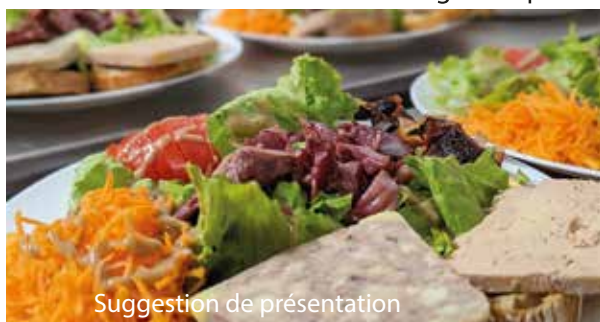
Suggestion de présentation

* l'abus d'alcool est dangereux pour la santé. À consommer avec modération.