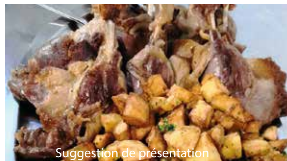
Suggestion de présentation